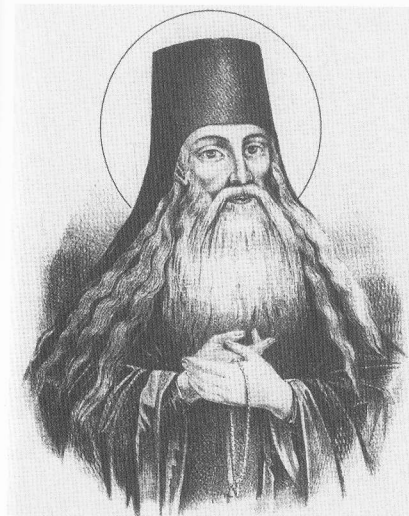
Cuviosul Paisie Velicikovski, a cărui predanie isihastă l-a înrâurit foarte mult pe Sfântul Gherman întreaga sa viață.